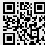
Рішення Хмельницького окружного адміністратив- ного суду